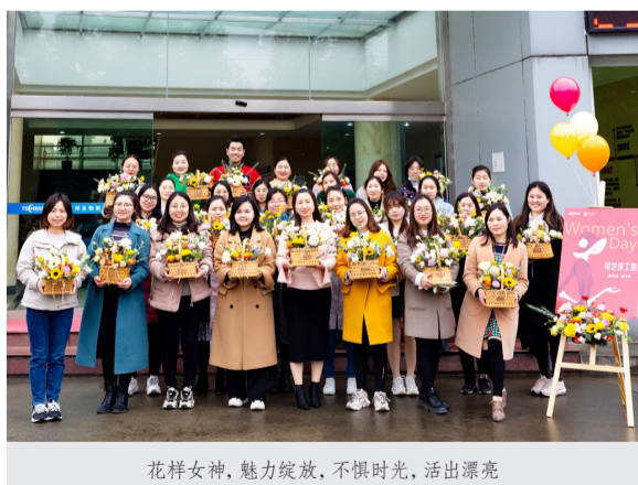
花样女神，魅力绽放，不惧时光，活出漂亮