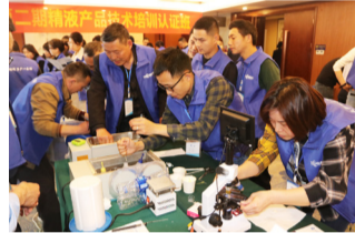
图：学员进行实操演练

应用先进育种技术，培育健康优质种猪，已成为大公司育种的坚定目标。当前非瘟的形势下，要求封群生产，减少种猪及运输风险，通过深部输精、冻精技术等提高优秀公猪的使用效率，也成了许多猪场的共识。因此，加强对猪场检测、技术人员及精液代理商在产品技术方面的培训，显得尤为重要。