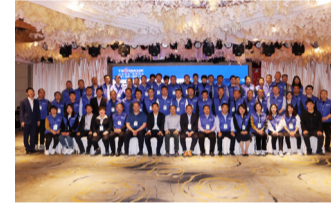
图：第二期精液产品技术认证培训学员与导师合影

第二期精液产品技术培训认证班继续聚焦精液产品的最新理论，探讨当前最新的育种水平，普及深部输精等猪精相关的前沿技术知识，通过系统的科普与指导后，继续进行鲜精与冻精等技