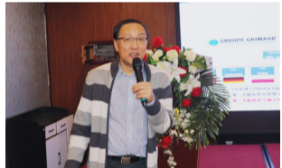
图：以国家命名种猪，其实是中国人的“创造”，只适用于少数做联合育种的国家的

早在20多年前，为了应对我国育种企业小的困境，我国就开始进行联合育种模式的尝试。由于丹麦等国家的联合育种公司更多将竞争对手定位在国际市场，而非国内市场，其联合育种有较好的合作根基；但中国的竞争在“内”，质量参差不齐且数量繁多的国内种猪公司在种源交流上很难达到国外的联合度，这导致我国在联合育种方面的推进至今不理想。