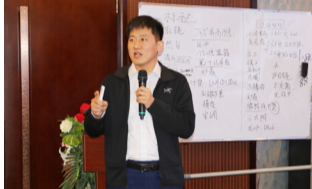
图：费尔蒙的深度刺激，可代替/联合查情公猪，提高繁殖成绩

查情时，无口鼻接触的母猪，可能会只有闻气味的动作，无咀嚼动作。而通过费尔蒙后的母猪，会有闻气味+咀嚼的表现，这是因为猪有2个嗅觉系统：主嗅觉系统的主嗅觉上皮细胞和副嗅觉系统的犁鼻器器官，静立反应时母猪受到了“深度刺激”，这才是更适合配种的时机。